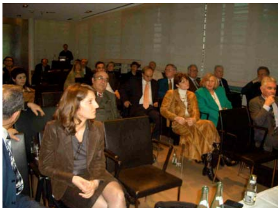
Auf der Mitgliederversammlung wurden interne Angelegenheit der DJG geregelt und die Neuwahl des Präsidiums und des Vorstands durchgeführt.

Rund 60 Teilnehmer aus ganz Deutschland und Jordanien nahmen an der internen Mitgliederversammlung und der sich anschließenden öffentlichen Vortrags- und Dialogveranstaltung teil.