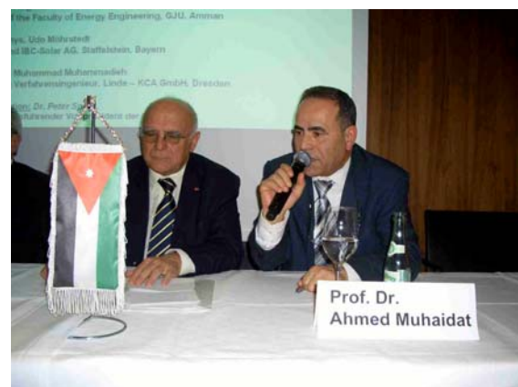
Teilnehmer des Podiums beantworten Fragen der Zuschauer.